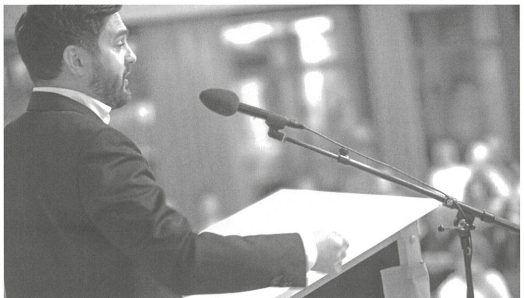
Cédric Wermuth in Münchenbuchsee

Cédric Wermuth begann mit einer ernüchternden Bestandsaufnahme: Der globale Liberalismus sei gescheitert – an der Finanzkrise, der Kaufkraftkrise, der wachsenden Ungleichheit und der Klimakrise. Aus diesem Versagen speist sich seiner Analyse nach der globale Rechtsruck, den er auf drei Ursachen zurückführt.